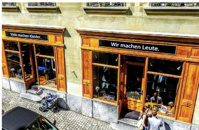
Vielfältig Kleider gibt es von der Stange und auf Mass. Kaffee und Bier an der shopeigenen Bar.

1 Vichy Wasser- und schweissfester SOS-Coverstick aus der Dermablend-Linie, CHF 23.- 2 Mádara SOS Hydra Repair Serum, wirkt ausgleichend, CHF 39.- 3 Lancôme Pflegekonzentrat Advanced Génifique Sensitive, CHF 99.- 4 Clarins SOS-Maske Pure, bei Unreinheiten, CHF 48.90