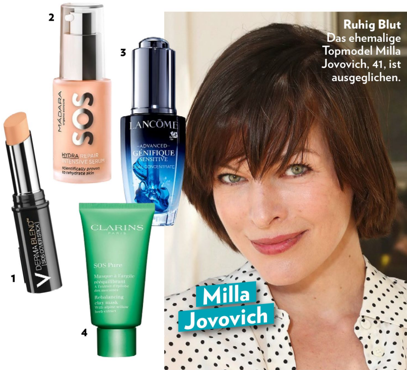
Ruhig Blut Das ehemalige Topmodel Milla Jovovich, 41, ist ausgeglichen.